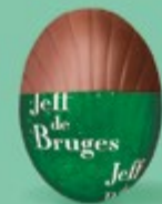
Praliné et éclats de crêpe dentelle