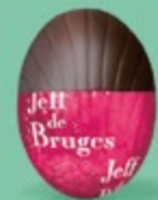
Praliné et éclats de noisettes caramélisées