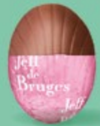
Praliné noisettes façon pâte à tartiner