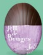
Praliné et biscuit sablé