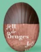
Praliné et noix de coco caramélisée