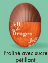
Praliné avec sucre pétillant