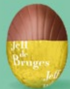
Praliné et éclats d'amandes caramélisées et salées