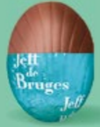
Ganache chocolat noir Équateur